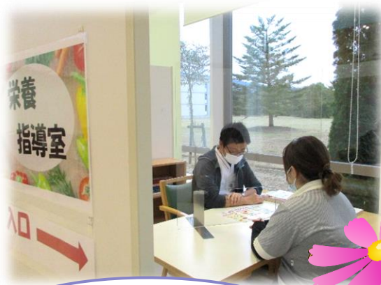
外来待合の一角に専用スペースを設けました