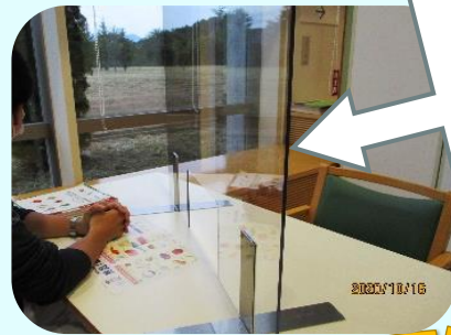
クリアパネルを設置