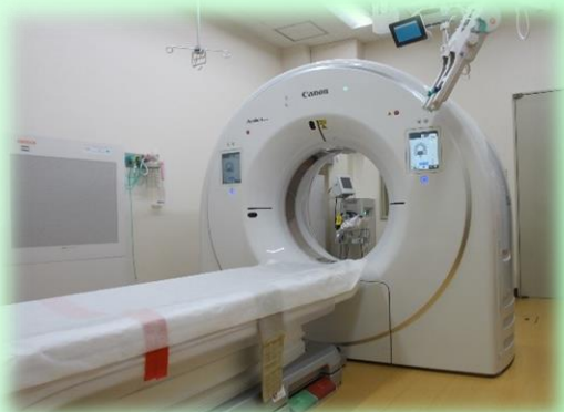
新CT装置 Aquilion Serve (キャノンメディカルシステムズ社製)

まず被ばく低減ですが、従来の装置に比べ20%～60%程度の被ばく低減がされています。さらに今回導入したCT装置では胸部の検査において、従来の10分の1の被ばくで検査が可能となっています。そしてAI技術の一つであるディープラーニング（深層学習）を利用した画像処理技術で、ノイズの少ない高品質な画像が提供できます。画質が向上することにより、小さな病変の発見やより正確な診断が可能となりました。