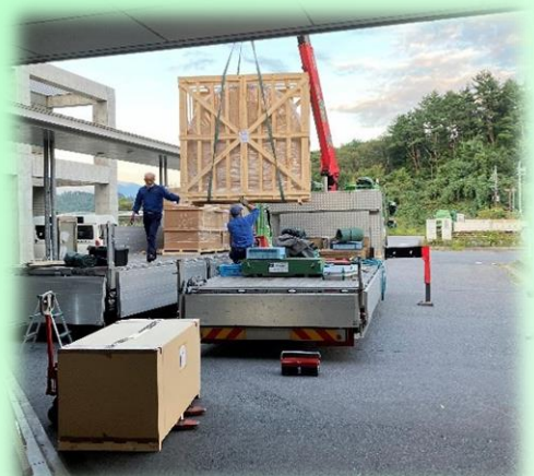
新CT装置搬入時の様子

放射線は目に見えず、感じることもできません。被ばくに関する事や放射線検査について心配なこともあると思います。そんな時は放射線に関わるプロフェッショナルとして放射線技師がわかりやすくお答えいたしますので、気軽にお声掛けください。