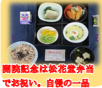
開院記念は松花堂弁当 でお祝い。自慢の一品